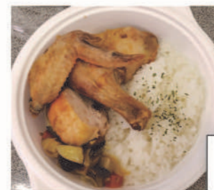
なないろキッチン