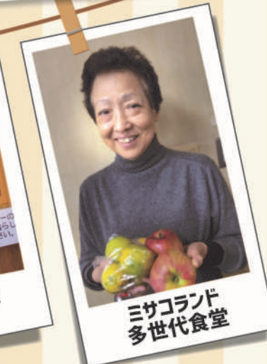
ミサコランド 多世代食堂