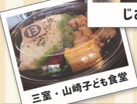
三室・山崎子ども食堂