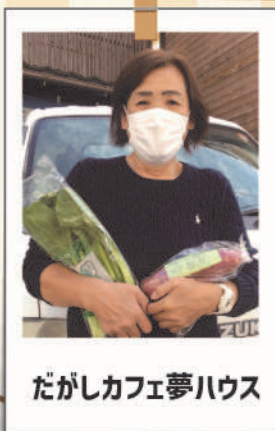
だかしカフェ夢ハウス