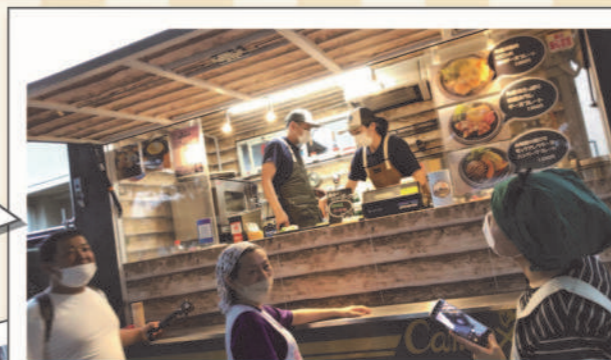
じおんじ子ども食堂