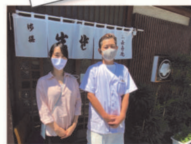
今羽のモリモリ食堂