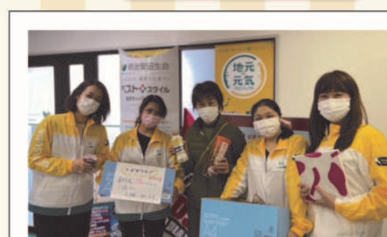
さとちゃんカフェ東浦和