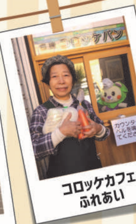
コロケカフェ ふれあい