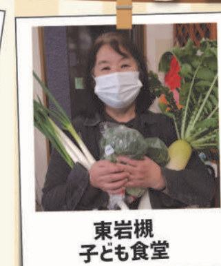
東岩槻 子ども食堂