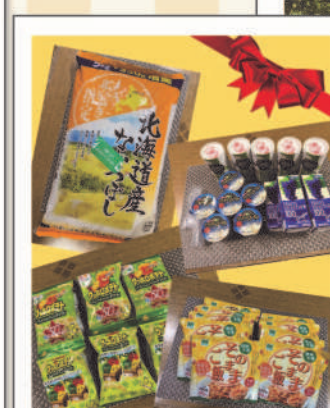
すくもぐ ネットワーク