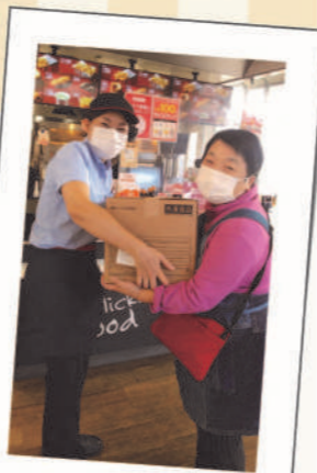
「ケンタ東浦和店様」 はるみちゃん食堂

「おいしいもので人をしあわせにしたい」これはカーネルの教えでありKFCの原点です。「食」にたずさわる企業として、食の喜びや楽しさ、大切さを伝えていくこと、次世代を担う子どもたちがいきいきと輝く笑顔になれるような未来の実現を目指しています。店舗を運営している中で閉店時にどうしても余ってしまう、まだおいしく食べられるチキンを食のニーズがある場所に届けることで、「健やかで心豊かな社会」と「子どもたちの成長」に貢献したいと考えています。同じ気持ちを持つ仲間として、地域の店舗と子ども食堂をつなげる活動をすすめていきます。